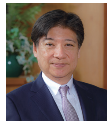
大阪医療センター 院長