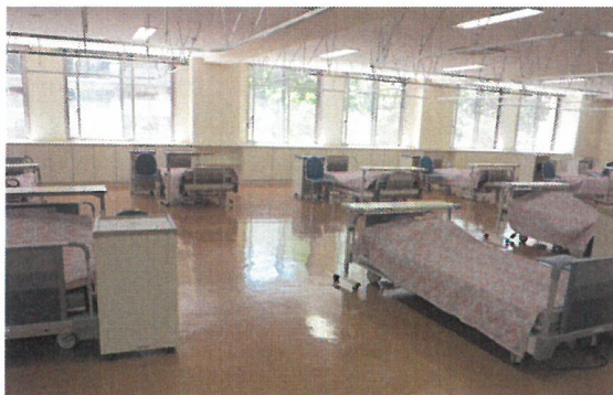
写真④ ベッドサイド実習室