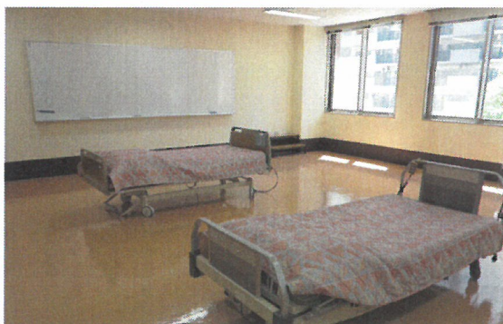
写真⑥ 成人看護実習室